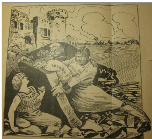
Il. 1. Zgrzyt pruski