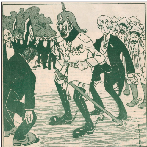
Il. 4. „Podczas pobytu u hr. Larischa w Karwinie na Szlązku austriackim”