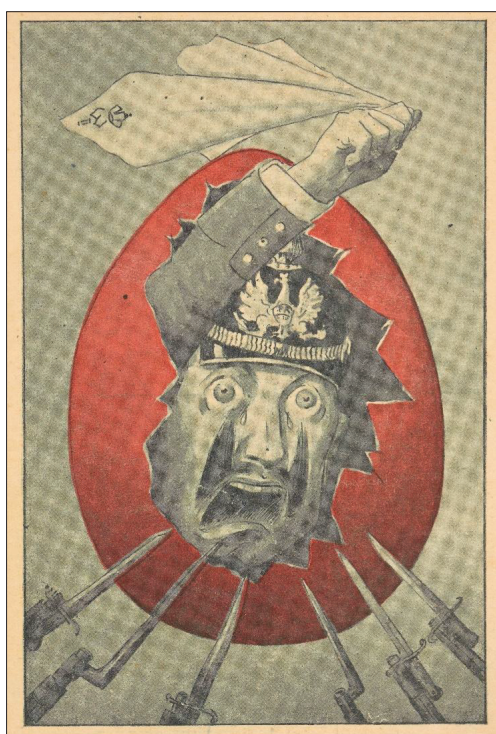
Il. 7. Wielkanoc