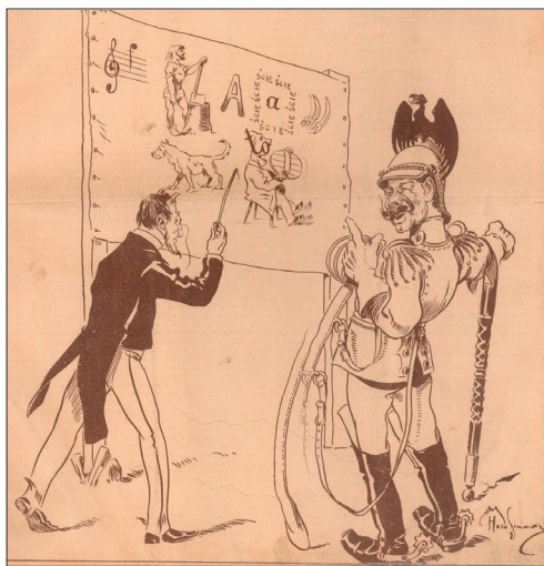
Il. 2. „Nareszcie zrozumiał”

procesów sądowych, szczególnie relacjonowanych przez media. Cień podejrzeń o homoseksualność padł i na samego cesarza. Skandal obyczajowy wykorzystali niechętni kajzerowi graficy i wydawcy pism satyrycznych, poprzez przedstawianie Wilhelma II jako osoby moralnie upadłej, motyw ten wykorzystywano i w kolejnych latach. W lutym 1911 r. w liście do berlińskiej centrali warszawski konsul Rzeszy August von Brück narzekał na to, że „Jego Wysokość jest dla prasy polskiej, szczególnie dla czasopism ilustrowanych, ulubionym przedmiotem nieprzyzwoitych dowcipów” 6 . Podał przy