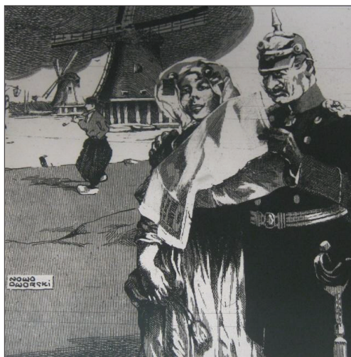
Il. 3. „Flisynga”