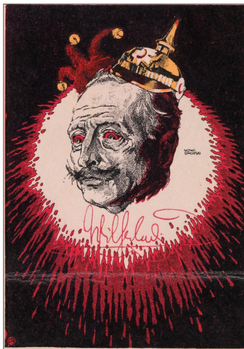
Il. 8. „Krwawy pajac”

Odnosząc się do sposobu relacjonowania przez polską prasę afery w Zabern z przełomu lat 1913 i 1914, kiedy to w alzackim miasteczku doszło do wystą-