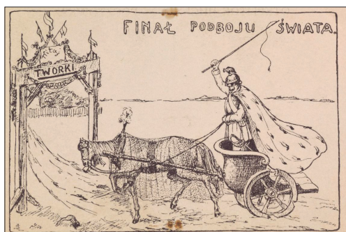
Il. 6. „Finał podboju świata”