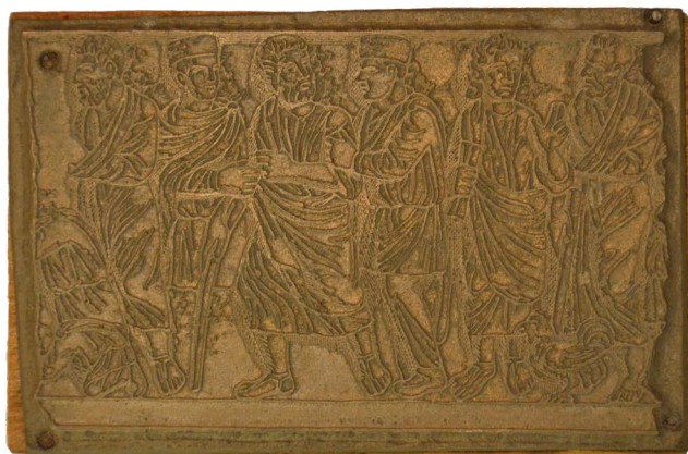
Il. 6. Sarkofag – detal: wyprowadzenie wody ze skały i pojmanie św. Piotra