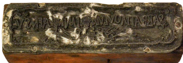
Il. 17. Epitafium: Sarbatia que vixit...