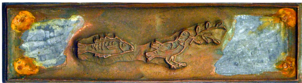
Il. 2. Epitafium: gołębica z gałązką oliwną i ryba, katakumby Pryscyli