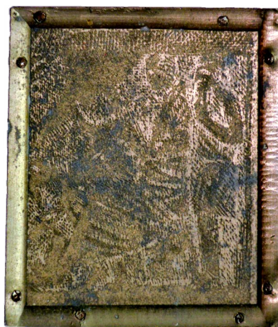
Il. 21. Sarkofag – detal: pokłon trzech mędrców