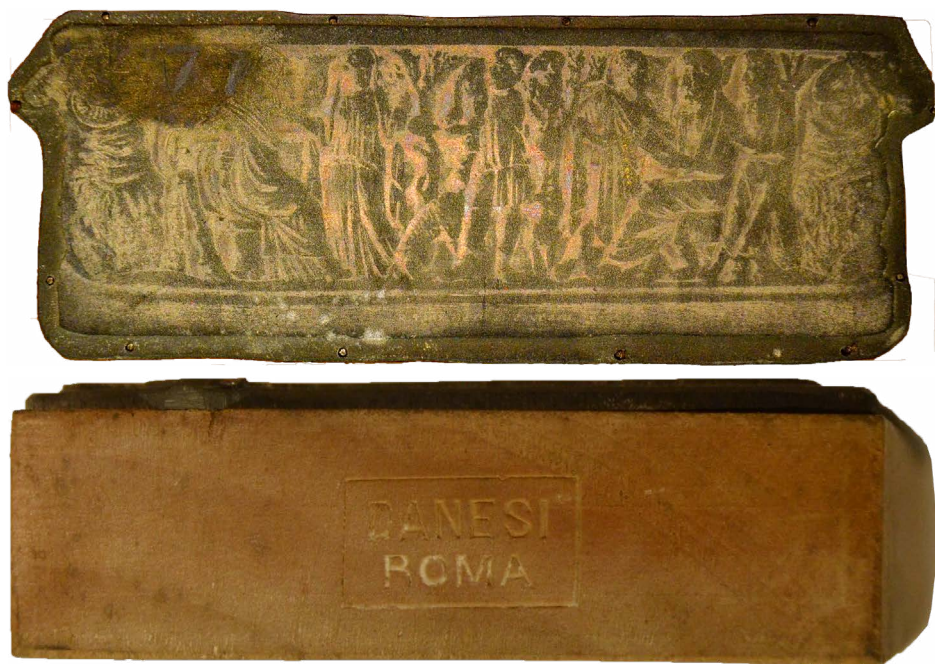
Il. 4. Sarkofag: tzw. sarkofag z via Salaria