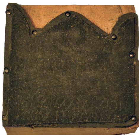
Il. 14. Epitafium: IXOYC