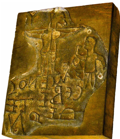
Il. 5. Graffiti z Palatyn: Aleksamenos cebet Teu