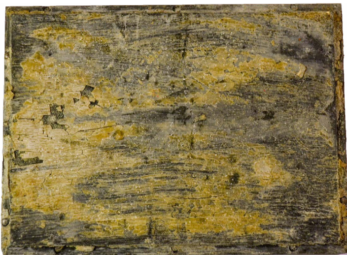
Il. 19. Fresk: scena uczty, Irene da calda, katakumba Piotra i Marcelina