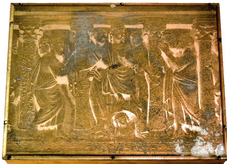
Il. 13. Sarkofag – detal: tzw. lateraneński