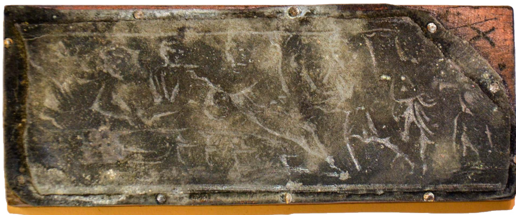
Il. 23. Sarkofag – detal: uczta, chrzest