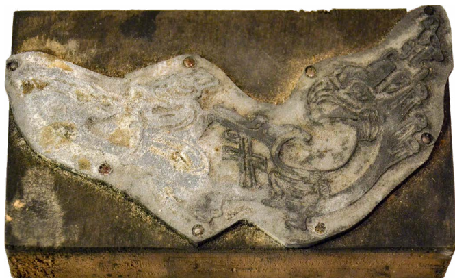
Il. 8. Lampka oliwna, Krzyż monogramatyczny, z Porto