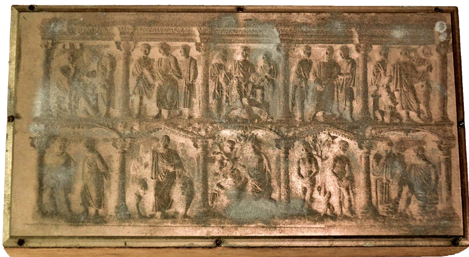
Il. 10. Sarkofag; tzw. sarkofag Juniusa Bassusa