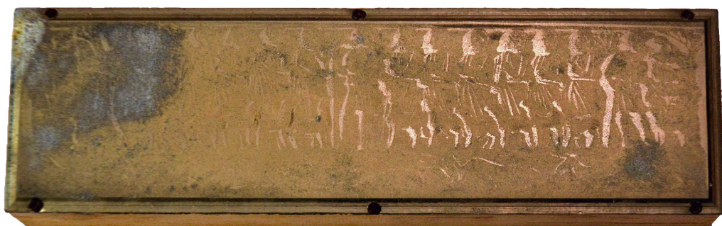
Il. 24. Sarkofag – Chrystus Pasterz i dwunastu apostołów