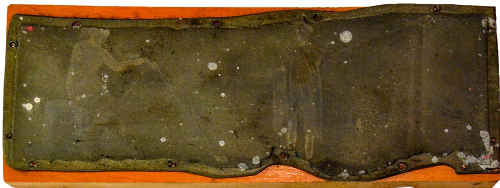
Il. 7. Fresk: scena wędkarzy i wyprowadzenie wody ze skały (Piotr lub Mojżesz?)