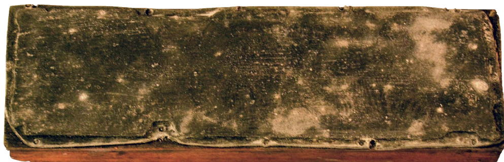
Il. 15. Skrzyńeczka z kości słoniowej Muzeum w Livorno, konsekracja?