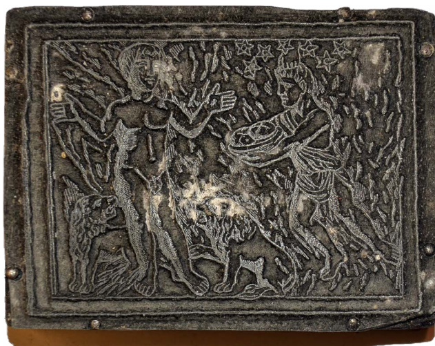
Il. 16. Sarkofag: sarkofag z Bresci: Daniel między lwami