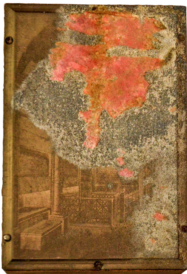
Il. 3. Fresk: cubiculum z balaskami