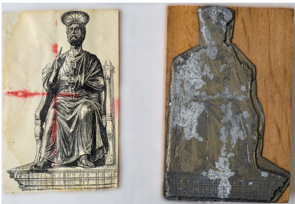
Il. 12. Rzeźba św. Piotra Watykan