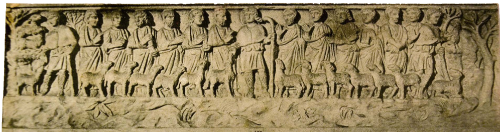
Il. 25. Pierwodruk dołączony do matrycy – sarkofag – Chrystus Pasterz i dwunastu apostołów – pierwodruk