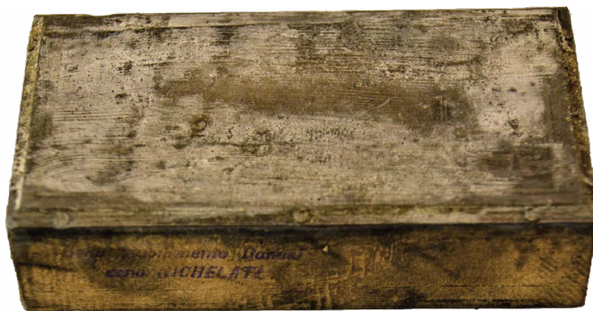
Il. 20. Fresk: cud rozmnożenia – arcosolium , krypta „owcza”, katakumba Kaliksta