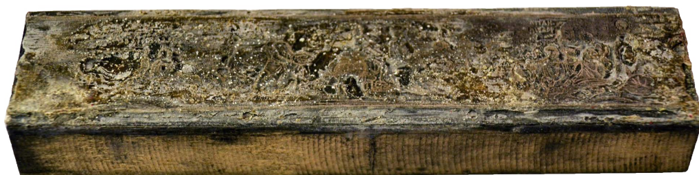
Il. 18. Fresk: wiele scen, uczta, katakumba z Aleksandrii (wg Rossiego)