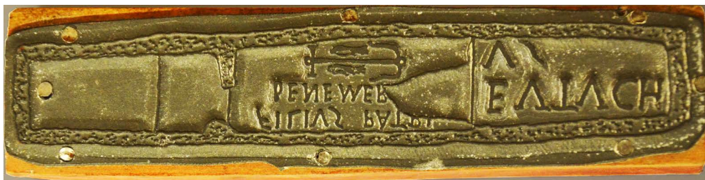
Il. 1. Epitafium: kotwica, dwie ryby, napis