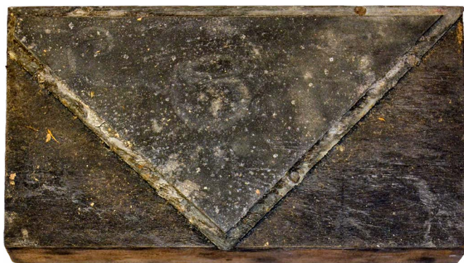
Il. 22. Fresk: plafon „naczynie mleczne”, katakumba Piotra i Marcelina